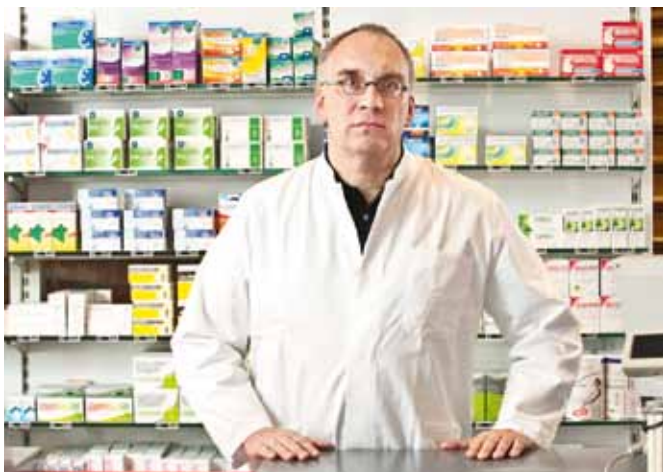
Gefahr für die Einzelapotheke: Die geplante Filialregelung bevorzugt Apotheken im Filialverbund und führt zu einer Wettbewerbsverzerrung.

Überwiegend positiv bewerteten die Apothekerorganisationen auch die Vorgaben zur Beratung. Diese hat im Referentenentwurf einen hohen Stellenwert. Die Apotheker werden dort verpflichtet, ihren Kunden grundsätzlich eine Beratung anzubieten