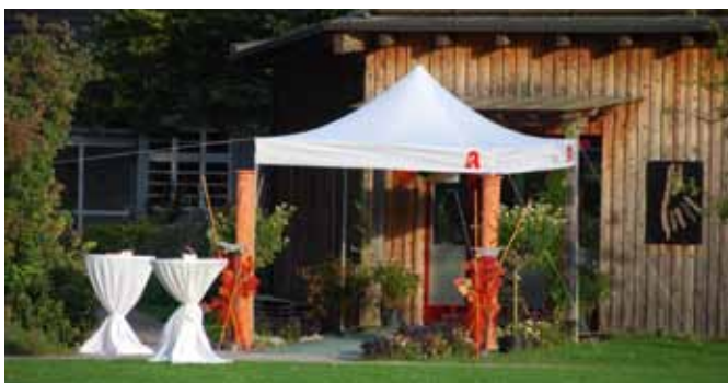
Gute Stimmung trotz grauer Wolken: Auch in diesem Jahr gewährte das Bienenhaus den Gästen einen gemütlichen Unterschlupf. Bei Kerzenschein genossen die Anwesenden kulinarische Köstlichkeiten und erlebten einen unterhaltsamen Abend.