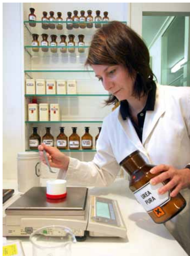
Kein Labor in Filialapotheken: Der Referentenentwurf sieht eine Sonderregelung für Filialverbände vor.

Nachdem mehr als dreißig Verbände und Einzelunternehmen zum Referentenentwurf Stellung genommen