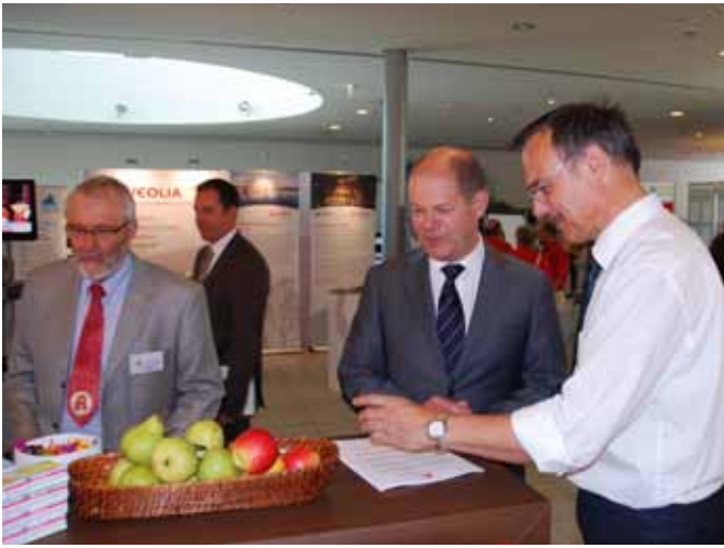
Apfel- oder Birnentyp: Olaf Scholz (Mitte), Oberbürgermeister der Stadt Hamburg ließ sich auf dem Landesparteitag der SPD von Jens-Peter Kloppenburg (rechts), Vorstand Apothekerkammer Niedersachsen, beraten.