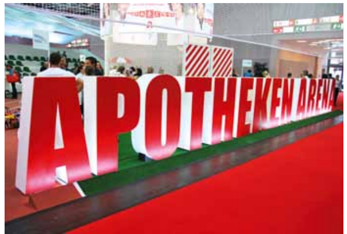
Apotheken als Partner im Sport: Die ABDA präsentierte sich in Düsseldorf mit ihrer neuen „Apotheken-Arena“, die das Engagement der deutschen Apotheker im Behindertensport anschaulich in den Vordergrund rückte.