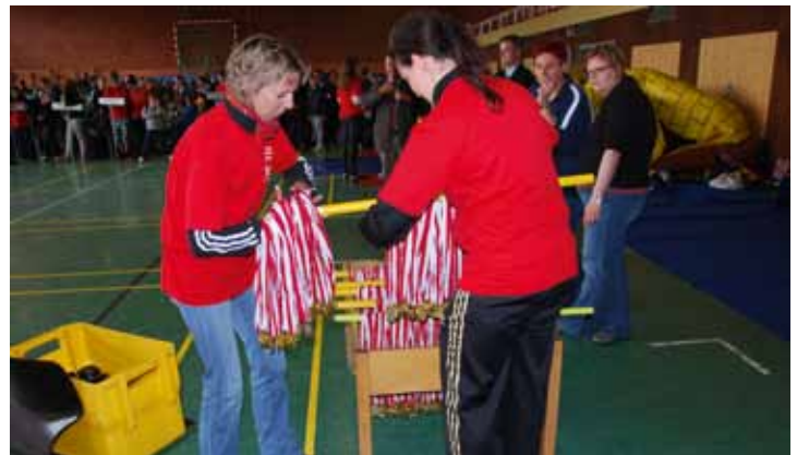
Höhepunkt des Sportfestes in Wardenburg: Bei der Siegerehrung erhielten alle Teilnehmer eine Goldmedaille.