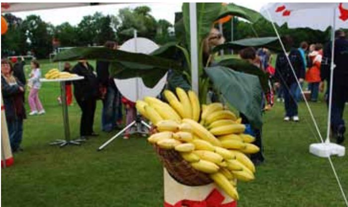
Gesunde Trostpreise: Für den notwendigen Vitaminkick war in Aurich gesorgt.