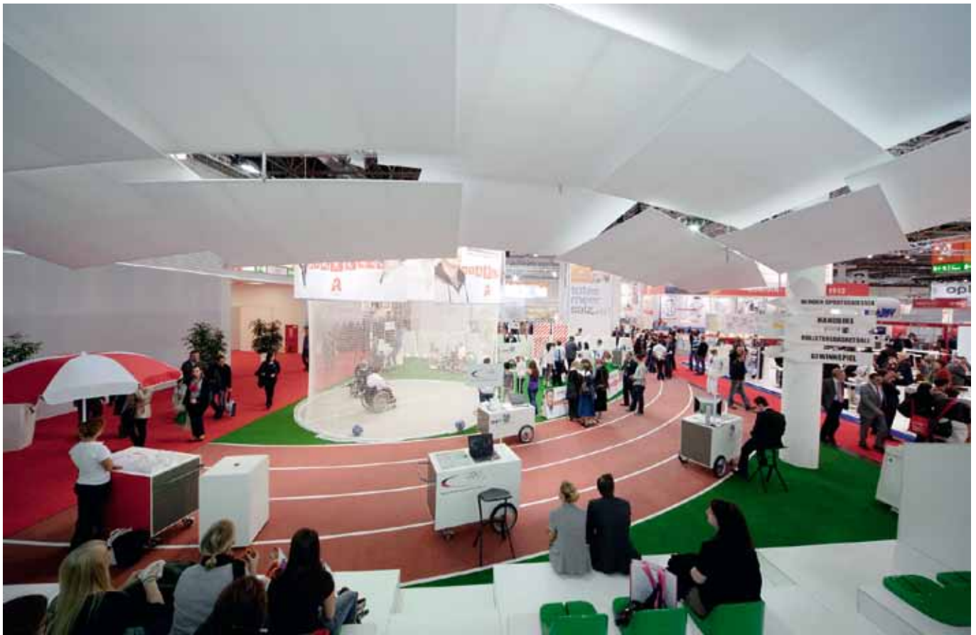
Stadionatmosphäre zum Anfassen: Ein Sport-Parcours sorgte auf dem ABDA-Stand für willkommene Abwechslung bei den Messebesuchern. Neben Rollstuhlbasketball konnten die Gäste ihr Geschick am Blindenbiathlon-Schießstand beweisen oder einen Streckenrekord beim Fahren mit dem Handbike hinlegen.