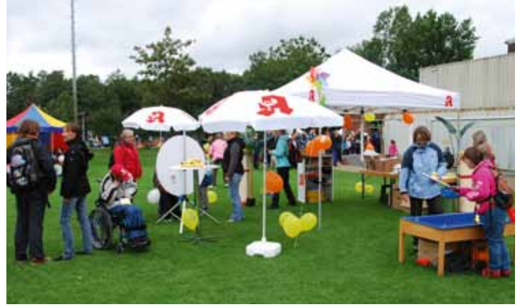
Trotz bewölktem Himmel: In Rotenburg/Wümme freuten sich die kleinen Teilnehmer über die spannenden Mitmach-Aktionen am LAV-Stand.