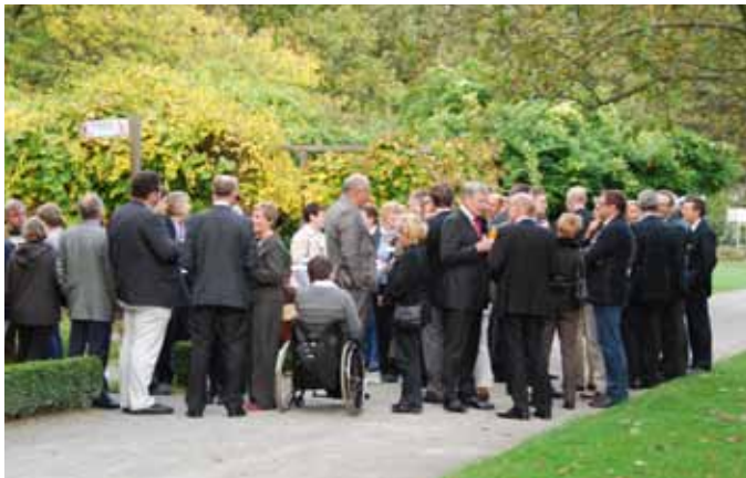
Treffen im Garten: Rund hundert Gäste waren auch in diesem Jahr wieder in den Apothekergarten gekommen, um sich auszutauschen, Kontakte zu knüpfen und die spätsommerliche Atmosphäre zu genießen.