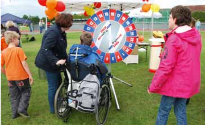
Viel Spaß und kleine Geschenke gab es in Aurich beim beliebten Glücksraddrehen am LAV-Stand.